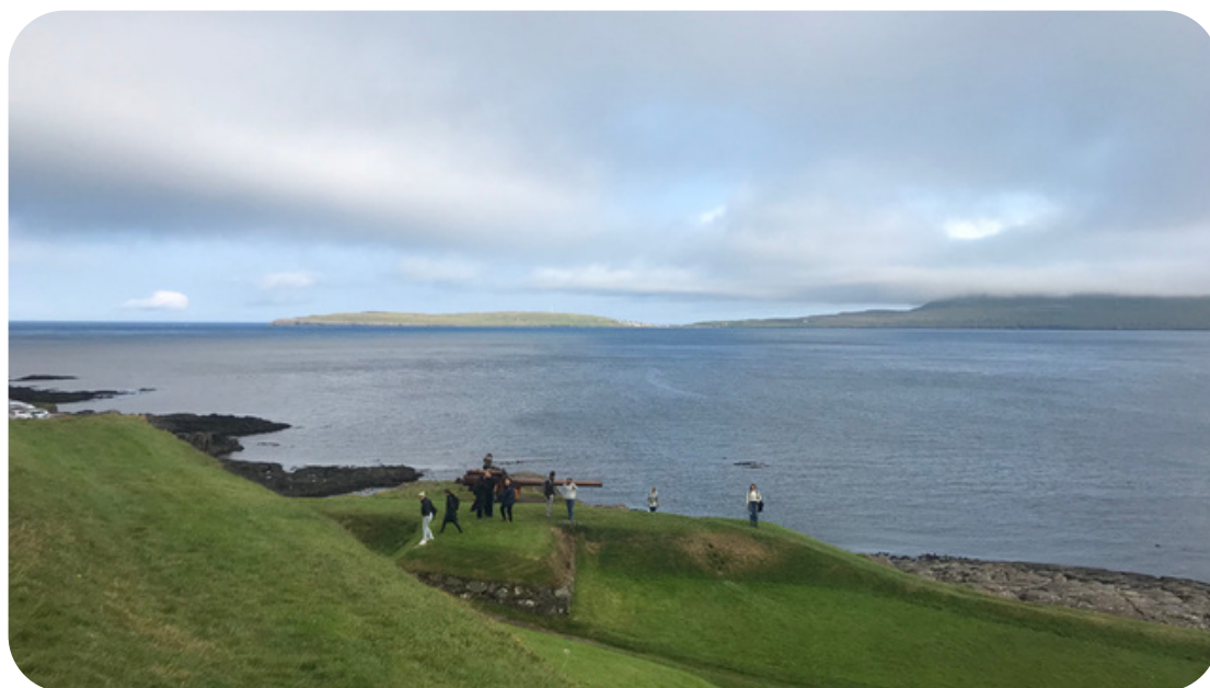
Fellows på vandretur - Færøerne 2021