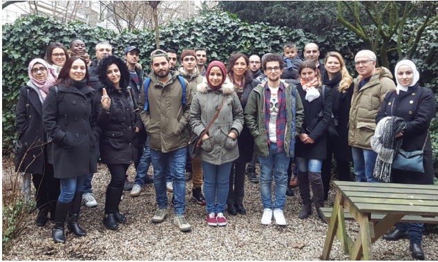
Human Rights Academy groep bezoekt het Anne Frank Huis

ners waar de deelnemers het netwerk van HIA leerden kennen en brachten we een bezoek aan het Anne Frank Huis in Amsterdam. Door de overweldigende aantallen aanmeldingen weten we dat er grote behoefte is aan dit project. De cursus in 2016 bestond uit acht bijeenkomsten, waarin iedere keer een ander recht centraal stond. Zowel de situatie in Nederland als in het land van herkomst werd besproken. De cursus is gegeven in drie talen; Farsi, Arabisch en Engels. Het project wordt gesteund door Vluchtelingenwerk, Wijdoenmee.nu en de FredFoundation.