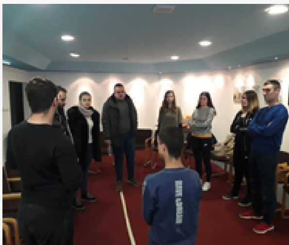
Radionica u Bileći

Niti jedan učesnik_ica radionice nije zadovoljan radom lokalne administracije u pogledu ažuriranja zvanične web stranice.